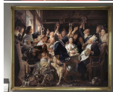
ヨルダース「豆の王様の祝宴」