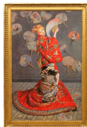
モネ「ラ・ジャポネーズ」