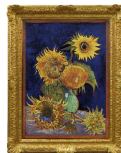
ゴッホの幻の「ヒマワリ」

1. 希望日 2. 代表者氏名 3. 人数 4. ご連絡先 をメールまたは電話でご連絡ください。