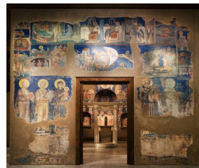
聖ニコラオス・オルファノス聖堂

〈日時〉 12/16(土)、17(日)、23(土祝)、24(日) 14:00～(約40分) 〈定員〉 30人(事前予約可) 〈集合〉 地下3階 インフォメーション横