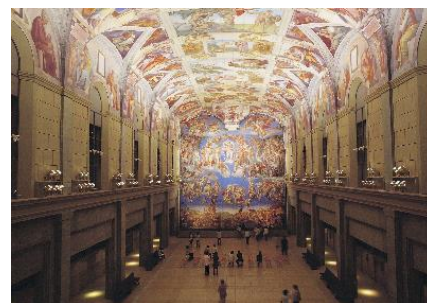
環境展示：「システィーナ・ホール」

高速バス 大阪/神戸など~「高速鳴門」2時間10分/1時間35分 →路線バス「小鳴門橋」バス停より 約15分 路線バス JR徳島駅より約70分、JR鳴門駅より約15分 ※いずれも「大塚国際美術館前」下車 神戸淡路鳴門自動車道 鳴門北ICから車で約3分 専用駐車場より無料シャトルバス運行