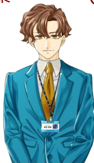
ゴッホ ふじた ごうほ 藤田 業穂 CV.畠中祐