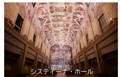
システイナー・ホール