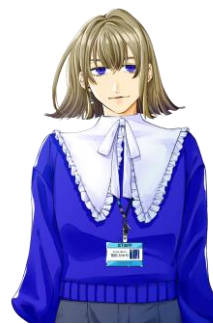
フェルメール あらた ひかり 荒田 ひかり CV.蒼井翔太