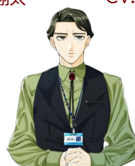
ムンク はらだ むく 原田 無口 CV.佐藤拓也