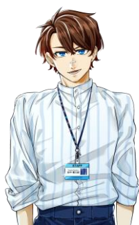
ミケランジェロ たなか らんたろう 田中 蘭太郎 CV.千葉翔也