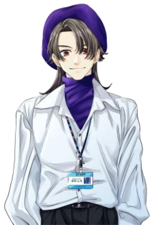
レオナルド・ダ・ヴィンチ きむら 木村 レオ CV.土屋神葉