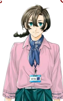
モネ ふくいけ もね 福池 萌音 CV.榊原優希