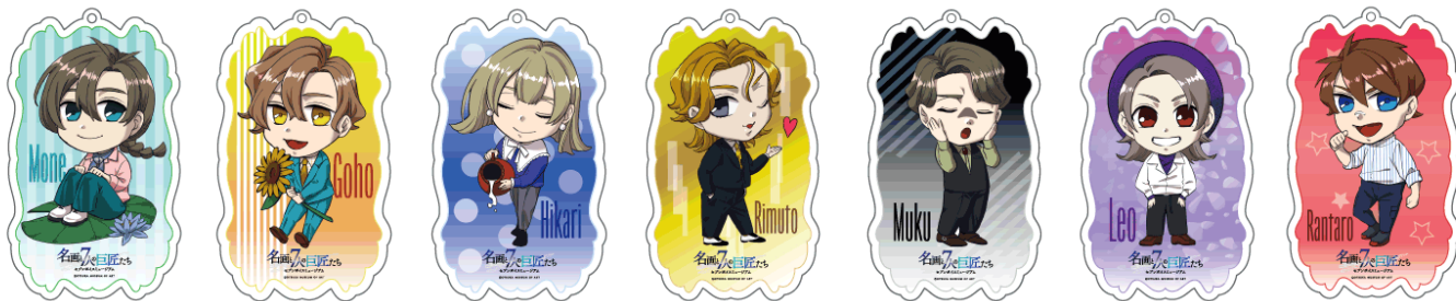
アクリルキーホルダー(全7種) 各440円(税込み)