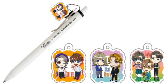
ボールペン(全3種)各440円(税込み)

※各種グッズは数に限りがございます。なくなり次第終了となります。あらかじめご了承ください。 ※その他のグッズ情報は順次、大塚国際美術館および番組公式ウェブサイトでお知らせいたします。