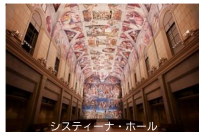
システイーナ・ホール

《お問い合わせ先》大塚国際美術館 学芸部 藤田 山側 TEL:088-687-3737 FAX:088-687-1117 MAIL:info@o-museum.or.jp ※ご来館に際し、必ずホームページの《安心・安全のための取り組み》をご一読ください