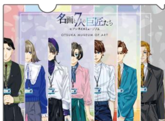
クリアファイル 330円(税込み)