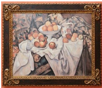
ポール・セザンヌ 《リンゴとオレンジ》 (オルセー美術館、パリ・フランス)

モネ、ゴッホに続く第3弾は、フランスの画家セザンヌとルノワールをセレクト！期間限定で、二人にちなんだランチやデザートをお楽しみいただけます。名画鑑賞の余韻に浸りつつ、アートなメニューをご賞味ください。