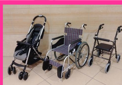
ベビーカー(1ヶ月~48ヶ月) 車椅子 歩行車(シルバーカー)

正面玄関の入退館口から展示フロアまでは、長いエスカレーターがございます。車椅子、シルバーカー、歩行補助器などをご使用の方や、エスカレーターのご利用が難しい場合は、入館方法と駐車場所をご案内しますのでお問合せください。(正面玄関にエレベーターはございません)