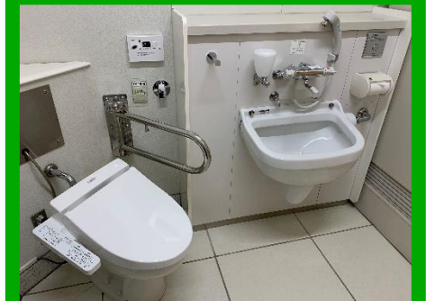
オストメイト対応