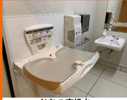
おむつ交換台 ※各フロアにあります