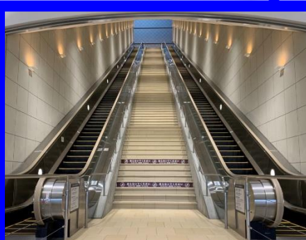
正面玄関 エスカレーター

正面玄関の入退館口から展示フロアまでは、長いエスカレーターがございます。車椅子、シルバーカー、歩行補助器などをご使用の方や、エスカレーターのご利用が難しい場合は、入館方法と駐車場所をご案内しますのでお問合せください。(正面玄関にエレベーターはございません)