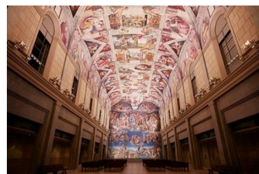
▲システーナ・ホール