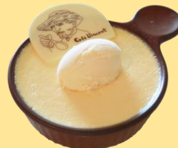
ゴッホの大きな黄色いプリン 650円(税込み) 地下3階カフェフィンセント