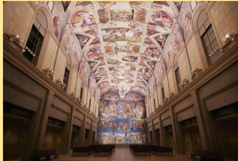
環境展示：システイーナ・ホール

館内はとても広く、順路約4km歩くだけで1時間。 贅沢に時間を使ってゆっくり鑑賞するのがおすすめ。