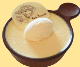
ゴッホの大きな黄色いプリン 650円(税込み) 地下3階カフェフィンセント