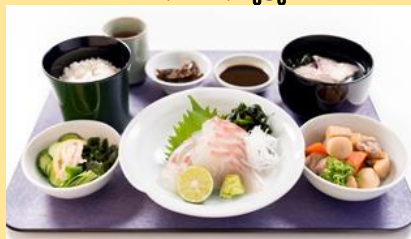
「鯛の刺身膳」1,200円(税込み) 1階レストラン・ガーデン