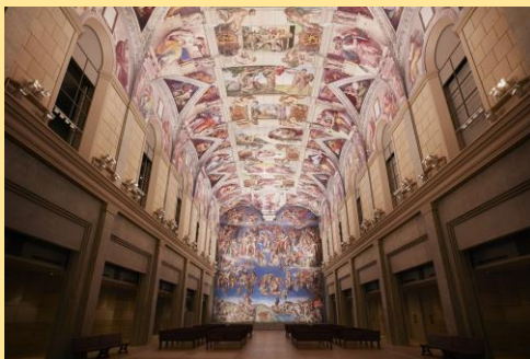
環境展示：システイーナ・ホール

館内はとても広く、順路約4km歩くだけで1時間。 贅沢に時間を使ってゆっくり鑑賞するのがおすすめ。