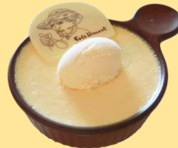
ゴッホの大きな黄色いプリン 650円(税込み) 地下3階カフェフィンセント