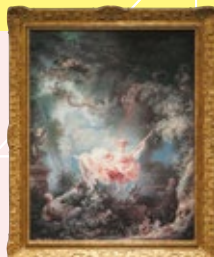
フラゴナール 「ぶらんこ」