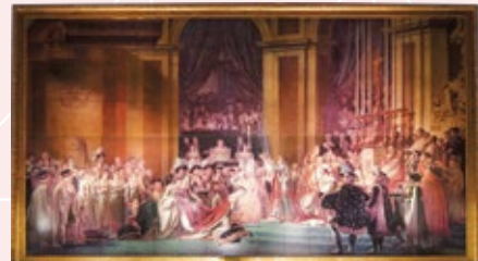
ダヴィッド 「皇帝ナポレオン1世と皇后ジョゼフィーヌの戴冠」