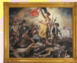
ドラクロワ 「民衆を導く自由の女神」