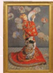
モネ 「ラ・ジャポネーズ」