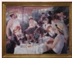
ルノワール 「ボート遊びの人々の食事」