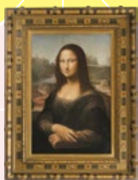
レオナルド・ダ・ヴィンチ 「モナ・リザ」