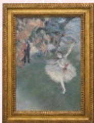
ドガ 「舞台の踊り子(エトワール)」