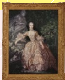
ブーシェ 「ポンパドール夫人の肖像」