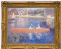
ルノワール 「セーヌ川の舟遊び」