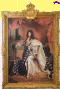
リゴール 「ルイ14世の肖像」