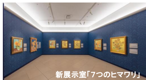
新展示室「7つのヒマワリ」