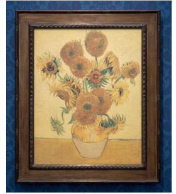
ゴッホ「ヒマワリ」 ナショナル・ギャラリー所蔵