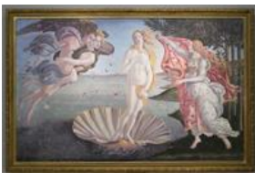
ポッティチェッリ 「ヴィーナスの誕生」