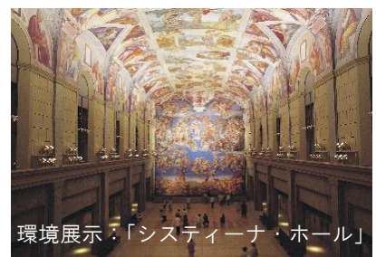
環境展示：「システィーナ・ホール」