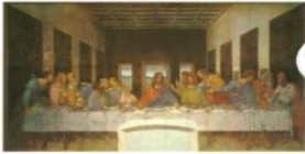
レオナルド・ダ・ヴィンチ 「最後の晩餐(修復後)」

名画や画家にちなんだメニューから、徳島県の名産品を使った色彩豊かなメニューまで、アートなメニューで心もお腹も満たされてはいかがでしょうか。