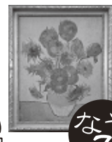
No. 706 「ヒマワリ」 フィンセント・ファン・ゴッホ

「最後の晩餐」に出てくる 人数に、作者ゴッホの大切な 人の人数を足した本数なんだって。