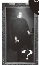
No. 421 「フェリーペ4世の肖像」 ディエゴ・ベラスケス