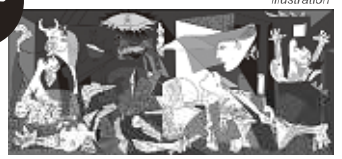
No. 951 「ゲルニカ」パブロ・ピカソ