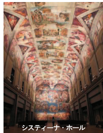
システィーナ・ホール