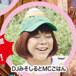
DJみそしるとMCこはん