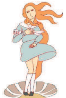
井上涼さん描き下ろし「ヴィーナス委員長」