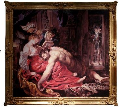
リュベンス「サムソンとデリラ」 ロンドン、ナショナル・ギャラリー所蔵