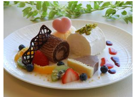
クリスマスデザート「ブッシュ・ド・ノエル」

【期 間】12月1日(日)～12月25日(水) 【価 格】700円(税込み) 【場 所】地下2階 カフェ・ド・ジヴェルニー 【時 間】10:30～16:00(フードメニュー14:30まで)