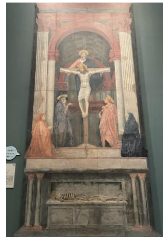
マザッチョ「三位一体」