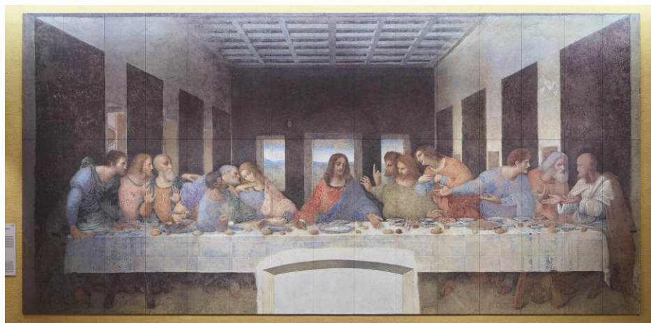
レオナルド・ダ・ヴィンチ「最後の晩餐」<修復後>

14世紀、中世末のイタリアは都市の時代と言えるでしょう。半島各地に都市国家が乱立し、今日に至る大都市の中心核が形成されるのもこの頃のことです。政治的にも経済的にも繁栄を謳歌したイタリア都市のシンボルとして大聖堂や市庁舎が建設され、そのインテリアを当代の画家たちの壁画が飾りました。その後、15世紀にルネサンスの時代が訪れると透視図法を用いた絵画表現が追求され、建築空間にも大きな影響を与えます。この講座では、絵画と建築、そしてその環境的背景としての都市空間に着目して、中世後期からルネサンスにかけての人々の空間認識がどのように変化し、ルネサンスの都市景観を生み出したのかを考えます。