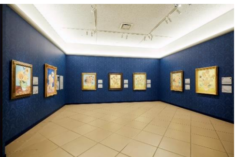
ゴッホ 7つの「ヒマワリ」

【住 所】〒772-0053 徳島県鳴門市鳴門町 鳴門公園内 【T E L】088-687-3737 【F A X】088-687-1117 【U R L】 https://www.o-museum.or.jp/ 【開館時間】9時30分から17時(入館券の販売は16時まで) 【休館日】月曜日(祝日の場合は翌日)、1月連続休館あり、その他特別休館あり *8月無休 【入館料】一般 3,300円 / 大学生 2,200円 / 小中高生 550円 *20人以上の団体は10%割引 【アクセス】