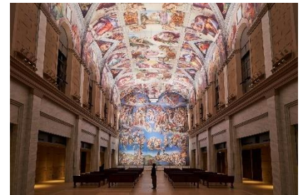
システィーナ・ホール