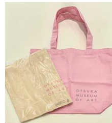
オリジナルエコバッグ(イメージ)