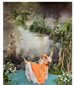
フラゴナール「ぶらんこ」