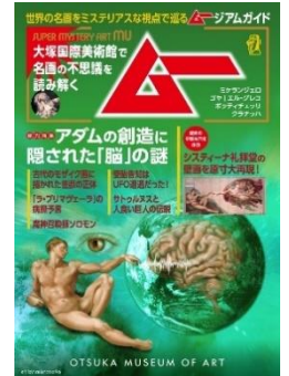
冊子・ステッカーデザイン(イメージ)