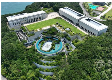
国立公園内上空から見た大塚国際美術館

館内では作品を間近で鑑賞でき、写真撮影も OK。全国から幅広い世代のお客様にご来館いただいています。