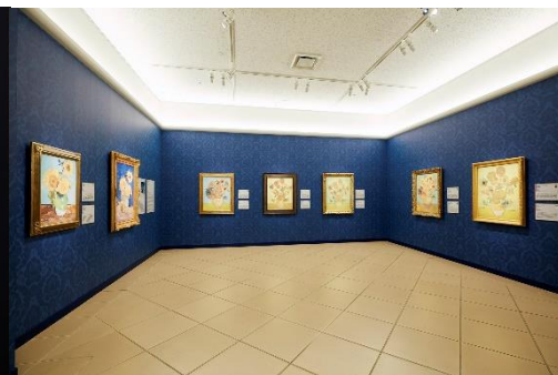
ゴッホ 7つの「ヒマワリ」