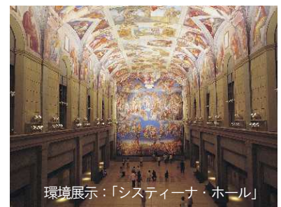
環境展示:「スティーナ・ホール」