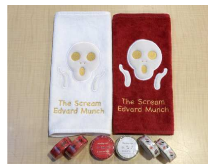
▲おめでたい！紅白グッズ