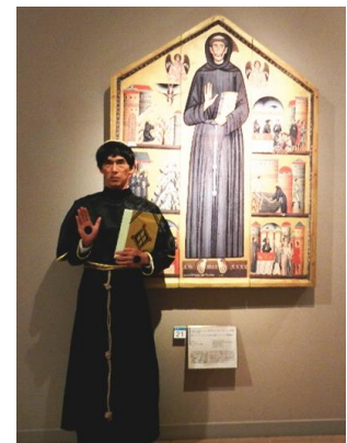
▲ベルリンギーエリ 「聖フランチェスコとその生涯」