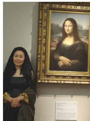
▲レオナルド・ダ・ヴィンチ 「モナ・リザ」