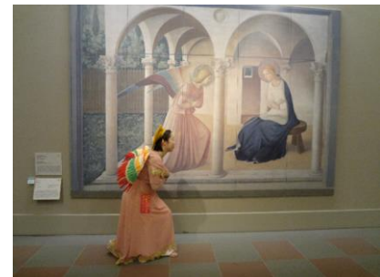
▲フラ・アンジェリコ「受胎告知」