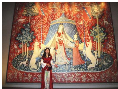
▲「わが唯一の望みの」 （「一角獣を従えた貴婦人」より）