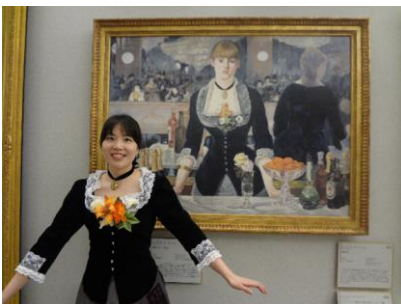
▲マネ「フォーリー＝ベルジェールのバー」