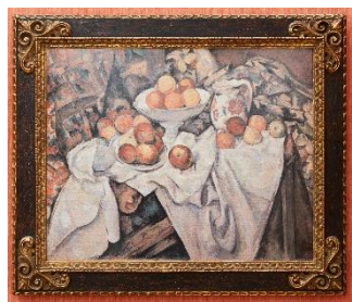
セザンヌ 「リンゴとオレンジ」