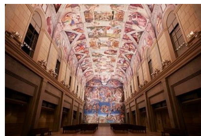
▲システィーナ・ホール