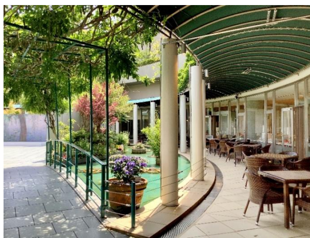
カフェ・ド・ジヴェルニーのテラス席で 睡蓮を眺めながらティータイム♪