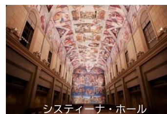
システイーナ・ホール