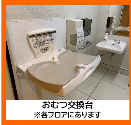
おむつ交換台 ※各フロアにあります