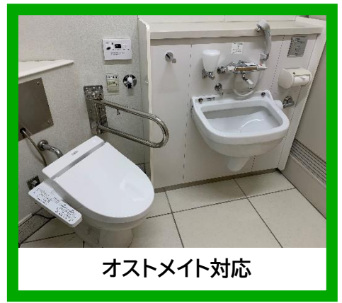
オストメイト対応