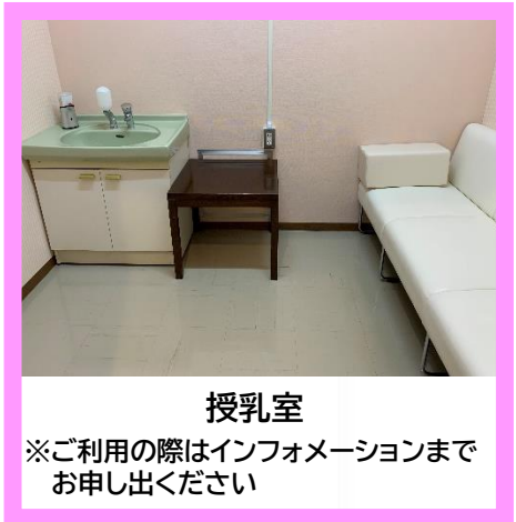
授乳室 ※ご利用の際はインフォメーションまで お申し出ください