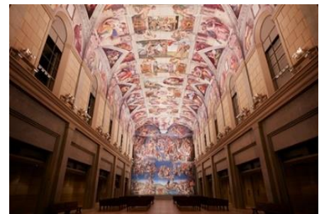
システイーナ・ホール