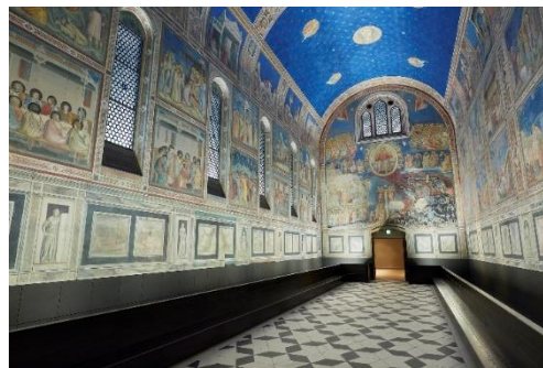
ジョット「スクロヴェーニ礼拝堂壁画」