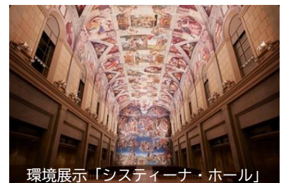
環境展示「システイーナ・ホール」