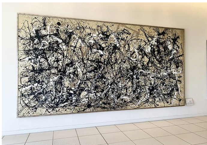
1950年制作、メトロポリタン美術館所蔵（ニューヨーク、アメリカ）

ジャクソン・ポロック の名作「秋のリズム:No.30」 【展示場所】1階本館 展示室 89