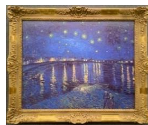
ゴッホ「ローヌ川の星月夜」▲