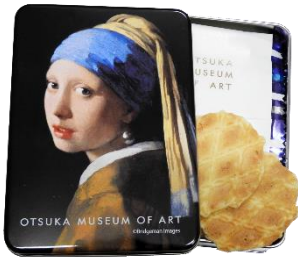
レスポワール クッキー缶 「真珠の耳飾りの少女」 (2枚入り×6袋) 864円

味はもちろん、パッケージデザインにもこだわった、お手軽サイズのアートなお菓子。大切な人や、なかなか会えないあの人へ、さらに自分への贈り物にもおすすめのミュージアムグッズは、通信販売・Amazonでも購入できます。