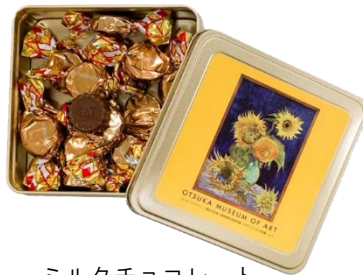
ミルクチョコレート 幻の「ヒマワリ」 (約15個入り) 540円