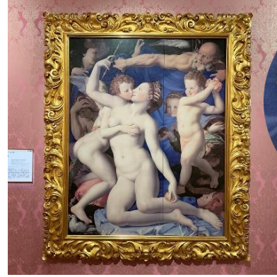
ブロンズイーノ「愛と時間の寓意」 1547年以前(ロンドン・ナショナル・ギャラリー蔵)