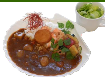
ヴィーナスカレー