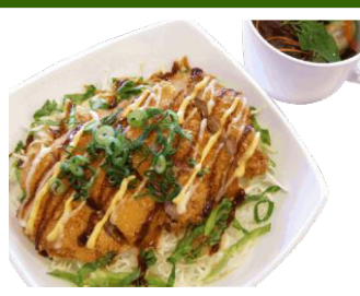
阿波尾鶏のチキンカツ丼