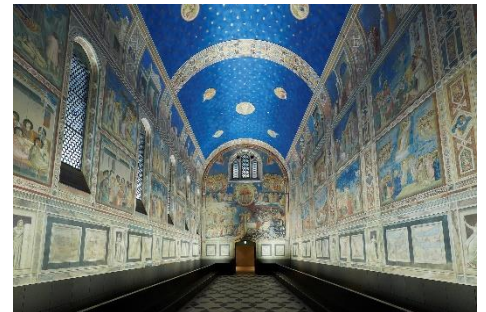
▲スクロヴェーニ礼拝堂

大塚グループ創立75周年記念事業として創業の地である徳島県鳴門市に設立した陶板名画美術館。古代壁画から世界26カ国190余の美術館が所蔵する現代絵画まで、1,000点を超える世界の名画を陶板で原寸大に再現し、展示しています。約4kmの鑑賞ルートには、レオナルド・ダ・ヴィンチ「モナ・リザ」、ゴッホ「ヒマワリ」、ピカソ「ゲルニカ」など、美術書などで一度は見たことがある名画が一堂に展示され、日本にいなから世界の美術館を体験できます。