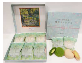
睡蓮まんじゅう 1296円 ミュージアムショップ 9:30～17:00