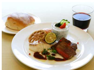
最後の晚餐 1800円 レストラン ガーデン 11:00～15:30(L.O15:00)