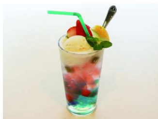
季節のクリームソーダ 650円 カフェ・ド・ジヴェルニー 10:30～16:00