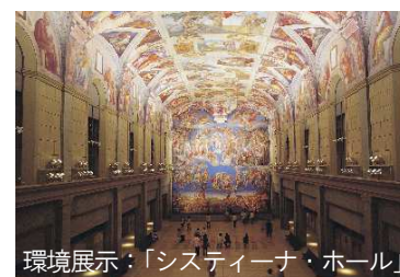
※画像は大塚国際美術館の作品を撮影したものです

高速バス 大阪/神戸など～「高速鳴門」 2時間10分/1時間35分 →路線バス「小鳴門橋」バス停より 約15分 路線バス JR徳島駅より約70分、JR鳴門駅より約15分 ※いずれも「大塚国際美術館前」下車 神戸淡路鳴門自動車道 鳴門北ICから車で約3分 専用駐車場より無料シャトルバス運行