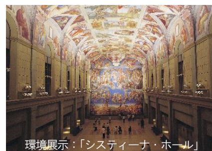
環境展示：「スティリーナ・ホール」

高速バス 大阪/神戸など～「高速鳴門」2時間10分/1時間35分 →路線バス「小鳴門橋」バス停より 約15分 路線バス JR徳島駅より約70分、JR鳴門駅より約15分 ※いずれも「大塚国際美術館前」下車 神戸淡路鳴門自動車道 鳴門北ICから車で約3分 専用駐車場より無料シャトルバス運行