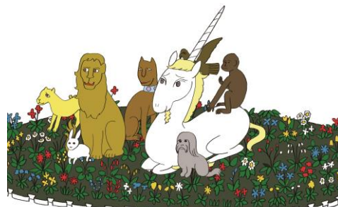
井上涼さん描き下ろし 左)「ヴィーナス委員長」 右)「ごめユニコーンと森の動物たち」