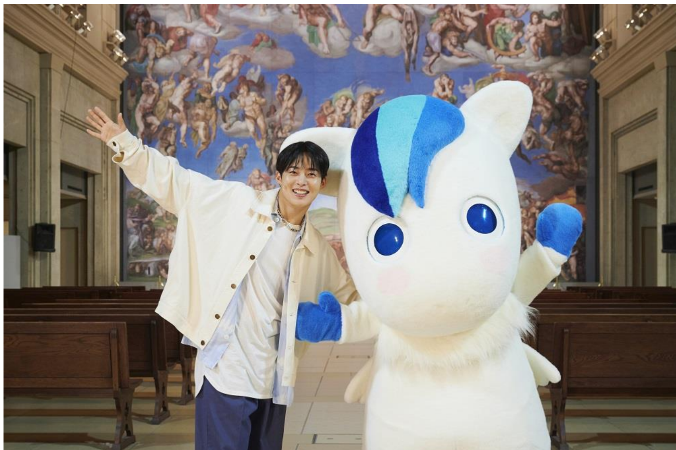
ミケランジェロ作「システィーナ礼拝堂 天井画および壁画」をバックに 左:ペク・グヨン氏 右:ペガっち

大塚国際美術館(徳島県鳴門市)は、多くの K-POP グループの振り付けを手がけるトップ振付師で、ダンスマスターのペク・グヨン氏に、公式キャラクター“ペガっち”の振り付けを依頼。