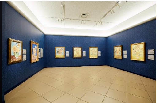
ゴッホ 7つの「ヒマワリ」

【住 所】〒772-0053 徳島県鳴門市鳴門町 鳴門公園内 【T E L】088-687-3737 【F A X】088-687-1117 【U R L】 https://www.o-museum.or.jp/