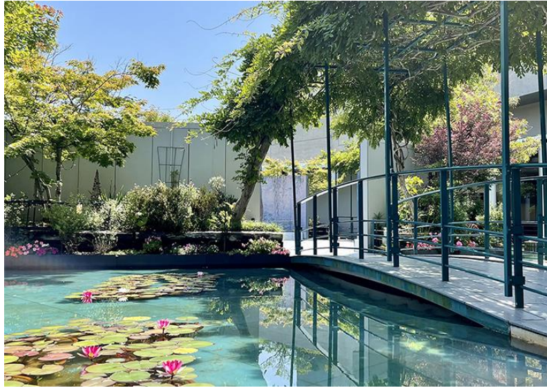
▲屋外展示:モネの「大睡蓮」(オランジュリー美術館所蔵)と周囲の池