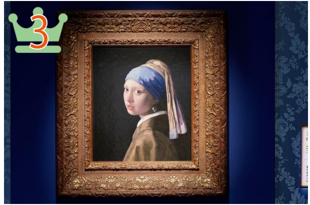
▲フェルメール、ヤン「真珠の耳飾りの少女」 (マウリッツハイス美術館所蔵)

陶板の特性を生かし屋外に展示した、当館ならではの名画が第1位に輝きました。印象派の画家モネが描いた睡蓮シリーズの集大成ともいえる作品で、夏には作品の周りの池にモネが愛した睡蓮が次々と開花し、名画鑑賞とともに楽しめるベストシーズンを迎えます。ランキングは以下の通り。