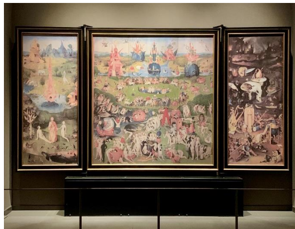
《快樂の園》 両翼を開いた状態 左)エデンの園 中央)快樂の園 右)地獄 ※当館では扉が自動で開閉します

亜熱帯風のエキゾチックな雰囲気は、コロンブスの新大陸発見による伝聞が影響していると考えられ、快樂の象徴として描かれたイチゴが目立つことから“イチゴ絵”とも呼ばれています。