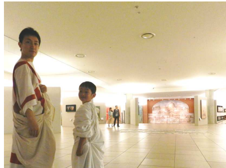
古代ローマ人にヘンシン！