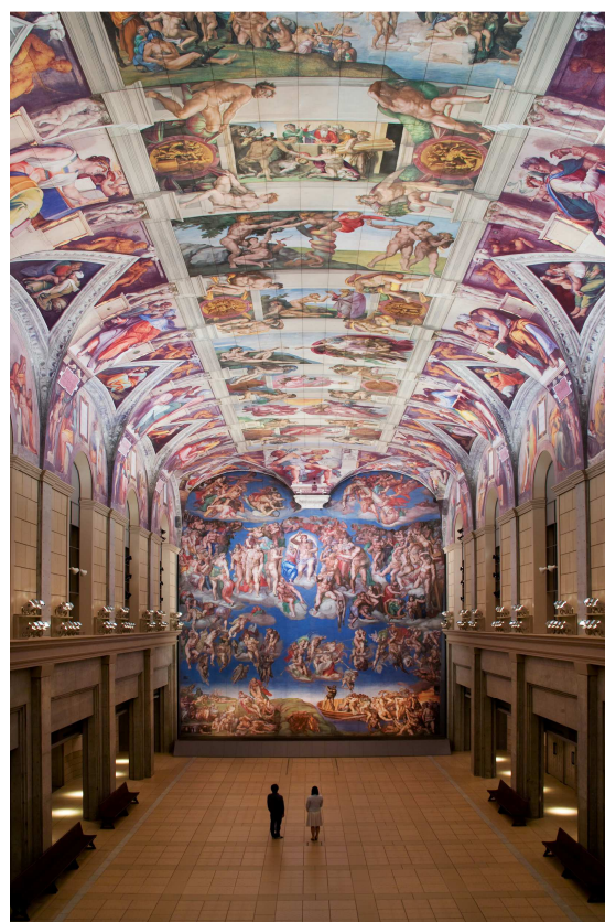
環境展示：「システーナ・ホール」