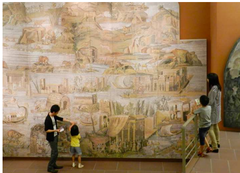
ファミリーで気ままに名画鑑賞