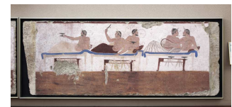
饗宴（コタボスの様子）