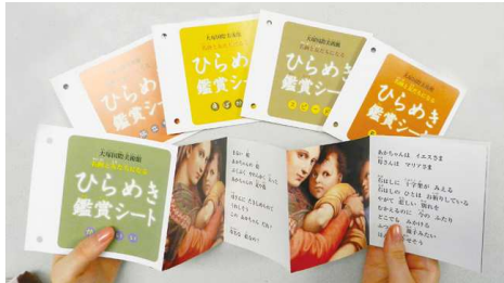
昨年の「ひらめき鑑賞シート イタリア編」