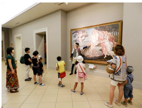
ナビゲーターと一緒に名画鑑賞（期間中の毎週土・日）