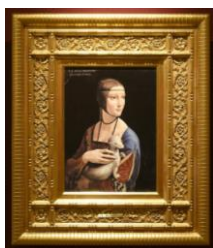
「白貂を抱く貴婦人」