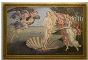
「ヴィーナスの誕生」