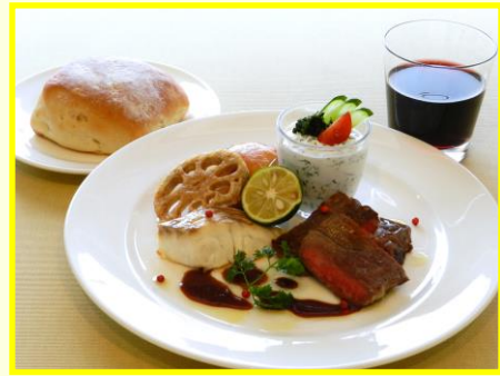
最後の晚餐 1800 円(税込み)

レオナルド・ダ・ヴィンチ作「最後の晚餐」の食卓を徳島の食材を使ってアレンジしたオリジナルメニューです。