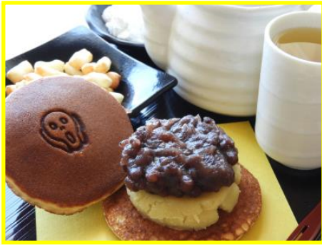
おいしいいー！と叫ぶムクのどら焼きセット