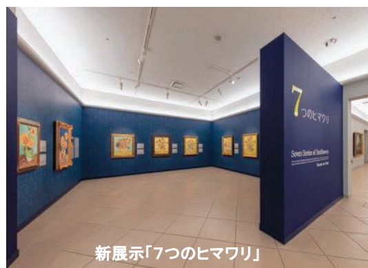
新展示「7つのヒマワリ」

ゴッホは南フランスのアルルで、花瓶に入った「ヒマワリ」を7点描きました。現在これらの「ヒマワリ」はオランダ、日本、ドイツ、イギリス、アメリカと世界各地に点在し、なかには個人蔵や戦禍によって焼失した作品も含まれています。大塚国際美術館は開館 20 周年記念事業として、これら全 7 点の「ヒマワリ」を陶板で原寸大に再現し、本年 3 月 21 日から常設展示。世界に類を見ない陶板名画美術館ならではの西洋絵画鑑賞をお楽しみいただけます。