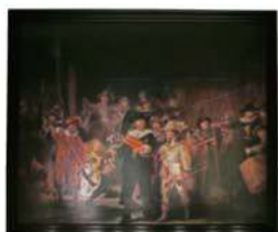
レンスラント 「夜警」のcock隊長