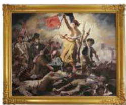
ドラクロワ 「民衆を導く自由の女神」の少年