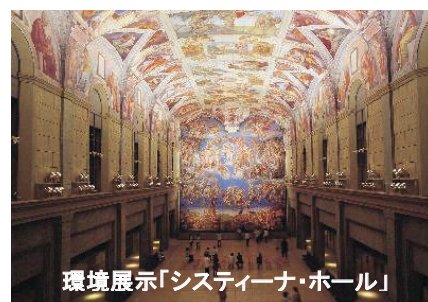
環境展示「システイーナ・ホール」

古代壁画から世界 25 カ国 190 余の美術館が所蔵する現代絵画まで、1,000 点を超える世界の名画を特殊技術によって、原寸大の陶板で忠実に再現しています。約 4km に及ぶ鑑賞ルートには、古代遺跡や礼拝堂を現地の空間そのままに再現した立体展示のほか、レオナルド・ダ・ヴィンチ「最後の晩餐」、ゴッホ「ヒマワリ」、ピカソ「ゲルニカ」など、美術書などで一度は見たことがあるような名画を美術史の流れに沿って展示しています。