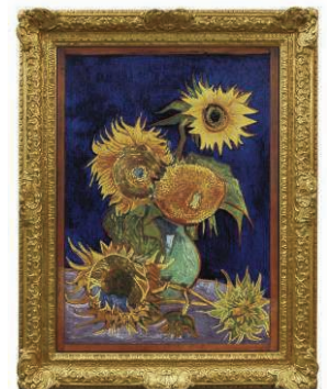
ゴッホの幻の「ヒマワリ」