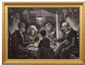
「ジャガイモを食べる人々」