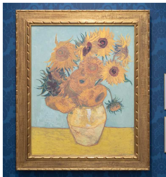
▲ゴッホ「ヒマワリ」ノイエ・ピナコテーク所蔵