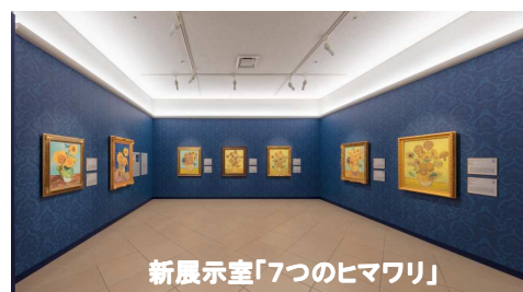
新展示室「7つのヒマワリ」