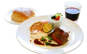
オリジナルメニュー「最後の晚餐」