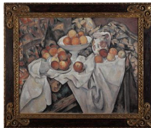
セザンヌ「リンゴとオレンジ」オルセー美術館蔵