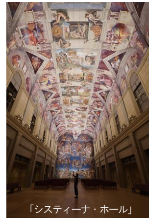
「システイーナ・ホール」

古代壁画から世界26カ国190余の美術館が所蔵する現代絵画まで、1000点を超える世界の名画を特殊技術によって、陶板で原寸大に再現。レオナルド・ダ・ヴィンチ「モナ・リザ」をはじめ、ゴッホ「ヒマワリ」、ピカソ「ゲルニカ」など、美術書などで一度は見たことがあるような名画が一堂に展示され、日本にいながら世界の美術館を体験できます。