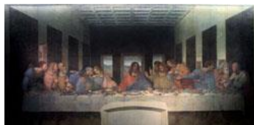
レオナルド・ダ・ヴィンチ「最後の晩餐(修復後)」 サンタ・マリア・デル・グラーツィエ修道院蔵