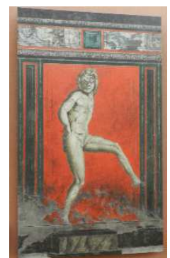
▲同じポーズをして体を動かそう