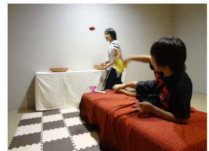
▲古代ローマのゲームコタボスにトライ