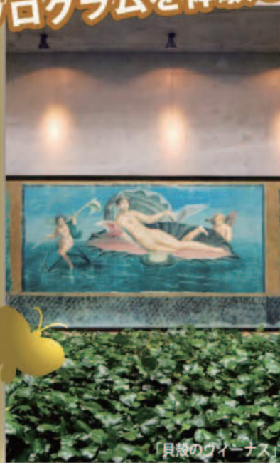
「貝殻のグイーナス」