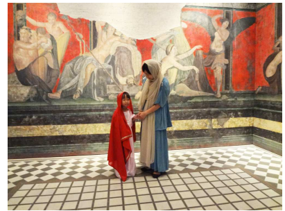
▲ヘンシンして絵の前で写真を撮パチリ

古代ローマの名言には現代にも通じるものがたくさん！ さあどんな名言がでるか… 引いてのお楽しみ。