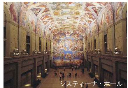
システイーナ・ホール

古代壁画から世界25ヶ国190余の美術館が所蔵する現代絵画まで、1,000点を超える世界の名画を特殊技術によって、原寸大の陶板で忠実に再現しています。約4kmに及ぶ鑑賞ルートには、古代遺跡や礼拝堂を現地の空間そのままに再現した立体展示のほか、レオナルド・ダ・ヴィンチ「モナ・リザ」、ゴッホ「ヒマワリ」、ピカソ「ゲルニカ」など、美術書などで一度は見たことがあるような名画を美術史の流れに沿って展示しています。