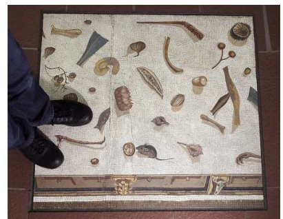
▲床モザイク画を元にパズルを考案