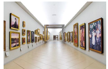
地下1階 近代展示室