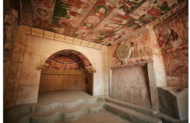
聖テオドール聖堂壁画