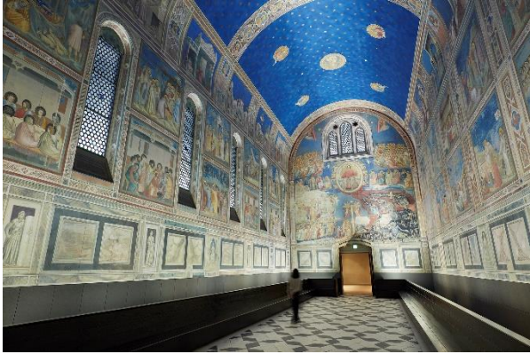
スロヴェーニ礼拝堂壁画

約1000点の展示作品の中には、イタリア、トルコ、フランスなど各国でそれぞれ世界遺産に登録されている地域の名作があります。なかでも古代遺跡や礼拝堂の壁画を陶板で原寸大に再現した展示は迫力満点。思わず息をのむ、圧倒的な臨場感を味わえます。