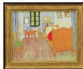
▲ゴッホ「アルルのゴッホの部屋」 オルセー美術館所蔵