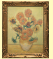
ゴッホ「ヒマワリ」 (東郷青児記念 損保ジャパン 日本興亜美術館所蔵)