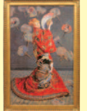
モネ「ラ・ジャポネーズ」 (ボストン美術館所蔵)