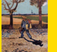
ゴッホ「ガラスコンへの道を行く画家」 (マクダブルク文化歴史博物館所蔵) 1888年制作、1945年消失

第二次世界大戦の最中、数奇な運命をたどり 消失したゴッホ唯一の全身自画像を陶板で 再現し常設展示します。