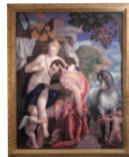
ヴェロネーゼ「ヴィーナスとマルス」 (メトロポリタン美術館所蔵)