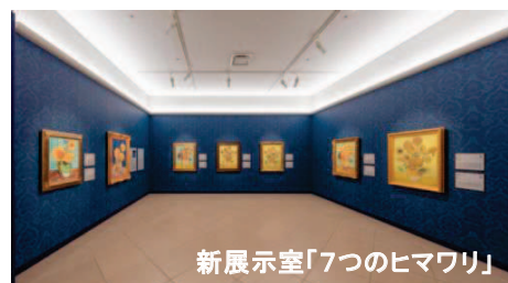
新展示室「7つのヒマワリ」