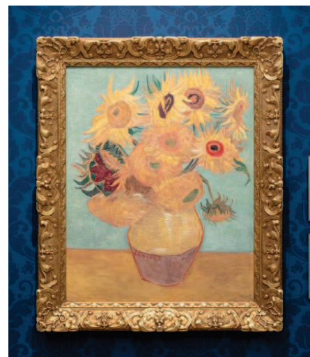
▲ゴッホ「ヒマワリ」フィラデルフィア美術館所蔵 ゴーギャンが12月にアルルを去ってから描いた6枚目の「ヒマワリ」。冬は花が咲いていないため、夏に描いた3枚目を模写しました。