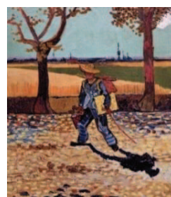
1888年アルルにて制作、1945年消失 Kulturhistorisches Museum Magdeburg, Germany 画像提供 48×41.8 cm

第2次世界大戦の最中、数奇な運命をたどり消失したゴッホ唯一の全身自画像を陶板で再現し常設展示するとともに、同作品をさらにもう1点制作し、かつて作品を所蔵していたドイツのマグデブルク文化歴史博物館(Kulturhistorisches Museum Magdeburg)へ贈呈いたします。陶板名画は色彩があせることなく半永久的に保存できることから、原寸大での鑑賞体験はもとより文化財の記録保存の在り方に大いに貢献できればと考えています。