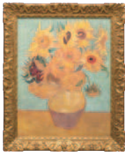
ゴッホ「ヒマワリ」 (フィラデルフィア美術館所蔵)