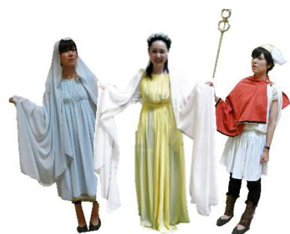
▲神々のアートコスプレの衣装(一部)