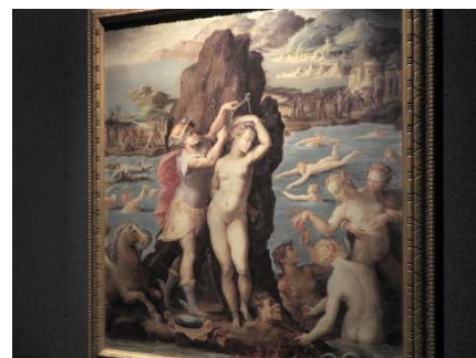
▲秋の星座にまつわる神話を題材にした作品