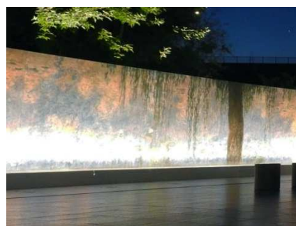
▲モネの晩年の大作も陶板で原寸大再現