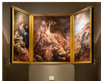
▲名作「フランダースの犬」に登場