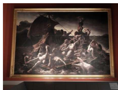
▲実際に起こった事件をもとにした作品