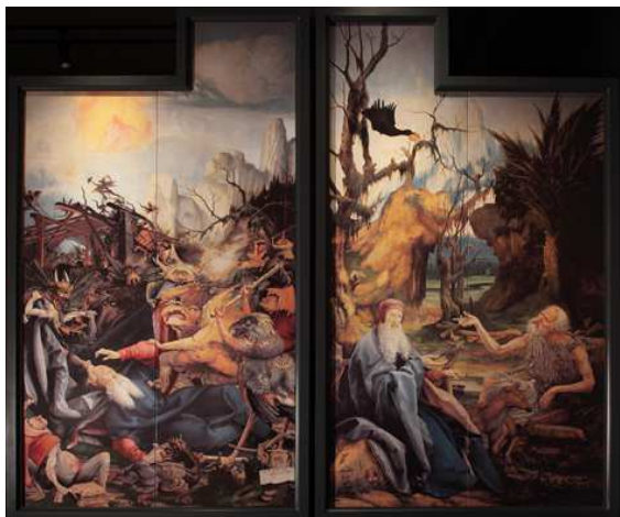
グリュネヴァルト「イーゼンハイムの祭壇画」 聖アントニウスに襲いかかる怪物は、いったい……。16世紀に描かれたモンスターたちに注目。

怪しい、可笑しい、不思議、不気味な絵画の数々。モンスターの足跡に導かれて展示室をめぐろう。「怪画」に潜むモンスターがあなたを待っている……。