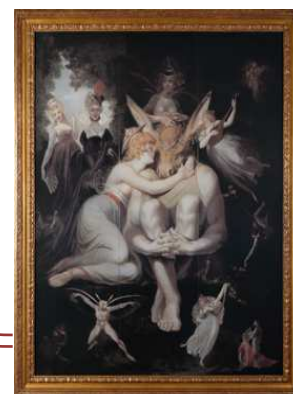
フュースリ「真夏の夜の夢」

昆虫を愛した画家が描く、シェイクスピア喜劇の一場面。劇には登場しない昆虫人間や妖精は、現実ではありえない比率で描かれており、幻想性豊かな世界が広がる作品。