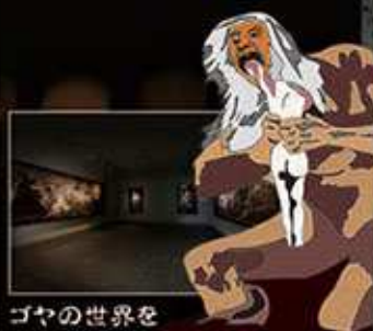
ゴヤの世界を 体感してください...