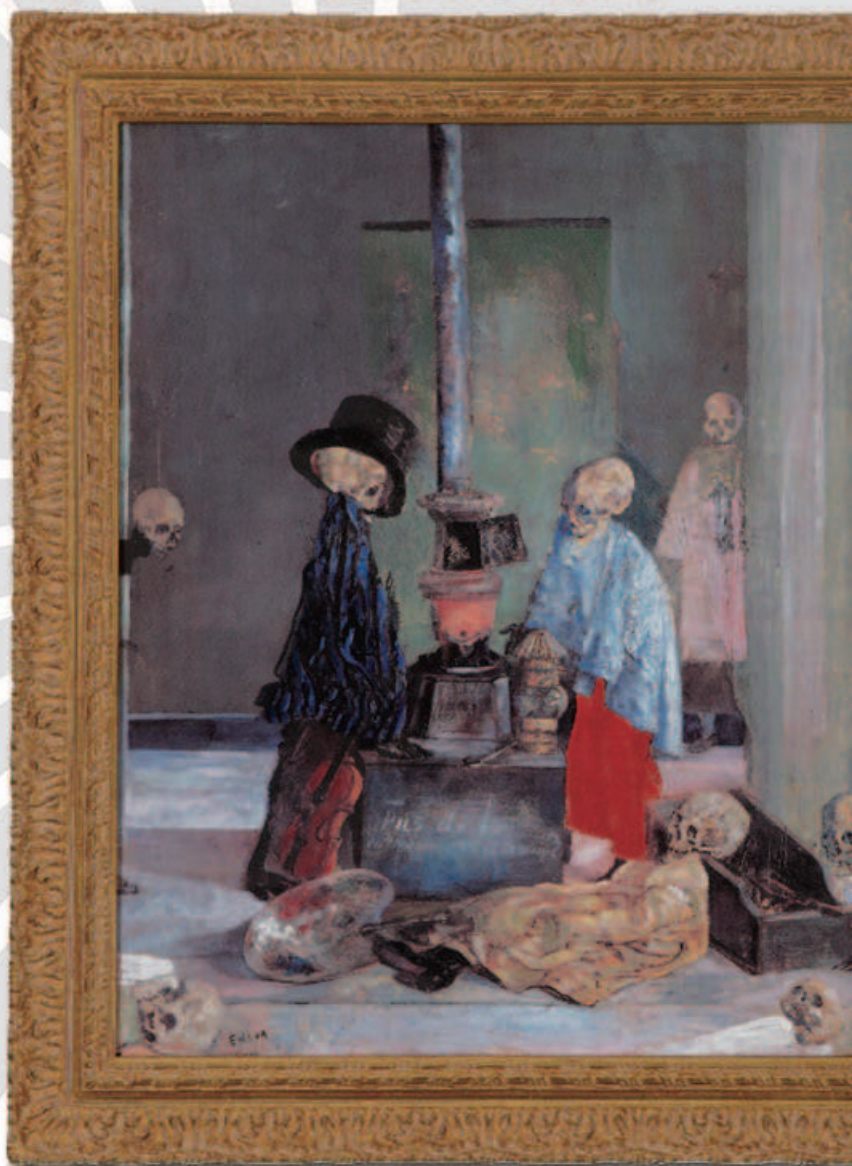
アンソール「ストーブで暖まる骸骨」