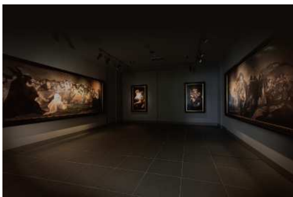
環境展示 ゴヤの家「黒い絵」食堂部分

ゴヤが晩年暮らしたマドリードの家の〈食堂〉と〈サロン〉の漆喰壁には、そのムードから通称「黒い絵」と呼ばれる14枚の連作がありました。ゴヤ没後の1870年代に壁面からカンヴァスに移され、現在はプラド美術館所蔵となっていますが、当館では当時の室内配置そのままに作品を原寸大で展示しています。