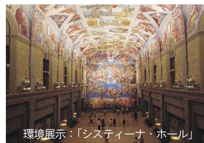
環境展示:「スティーナ・ホール」 ※画像は大塚国際美術館の作品を撮影したものです

高速バス 大阪/神戸など~「高速鳴門」2時間10分/1時間35分 →路線バス「小鳴門橋」バス停より 約15分 路線バス JR徳島駅より約70分、JR鳴門駅より約15分 ※いずれも「大塚国際美術館前」下車 神戸淡路鳴門自動車道 鳴門北ICから車で約3分 専用駐車場より無料シャトルバス運行