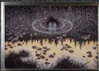
キッテルセン「湖の怪物」