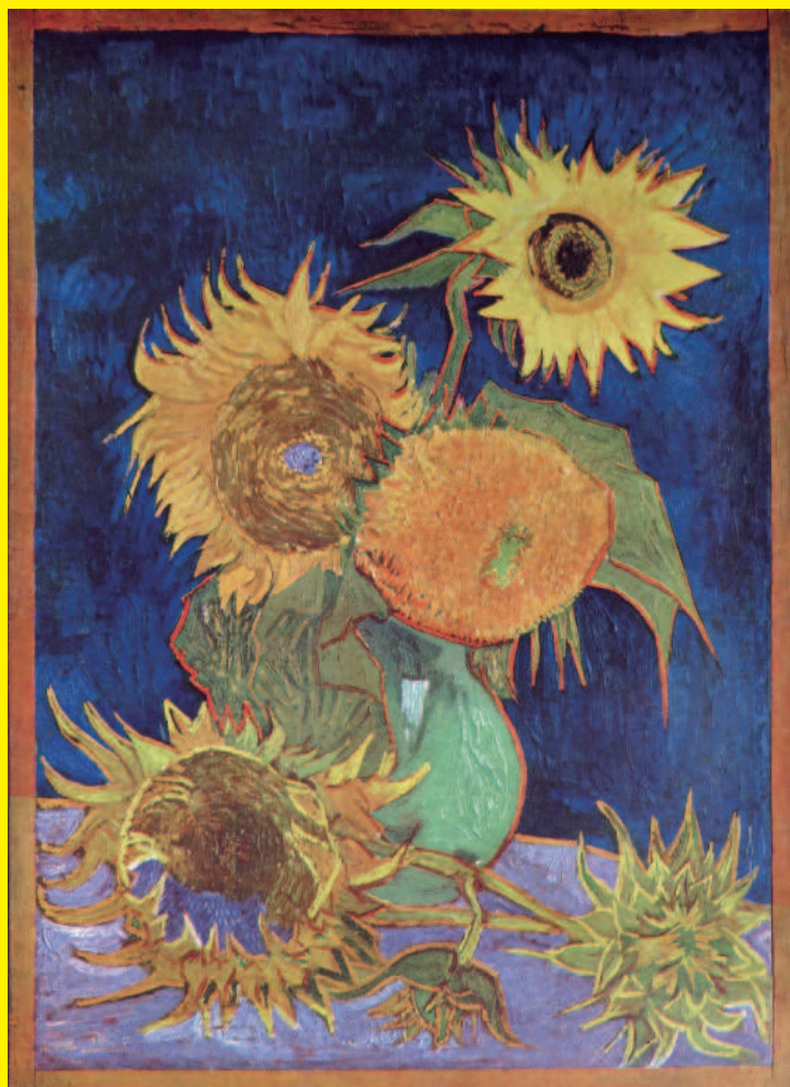
「ヒマワリ」1945年焼失 油彩・キャンバス 98×69 cm 武者小路実篤記念館蔵 「セザンヌゴッホ画集」より