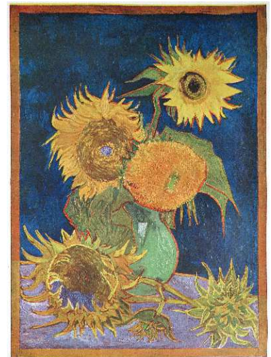
「ヒマワリ」1945年焼失 油彩・キャンバス98×69cm （武者小路実篤記念館蔵 「セザンヌゴッホ画集」より）

日本文化を愛したゴッホ、そしてゴッホの作品に魅了された実篤ら白樺派。かつて日本にあった名画に想いを馳せることで、美術への関心が高まり、絵画を鑑賞し愛好するきっかけになればと願っています。